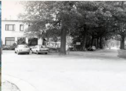
Gasthof Van Thillo